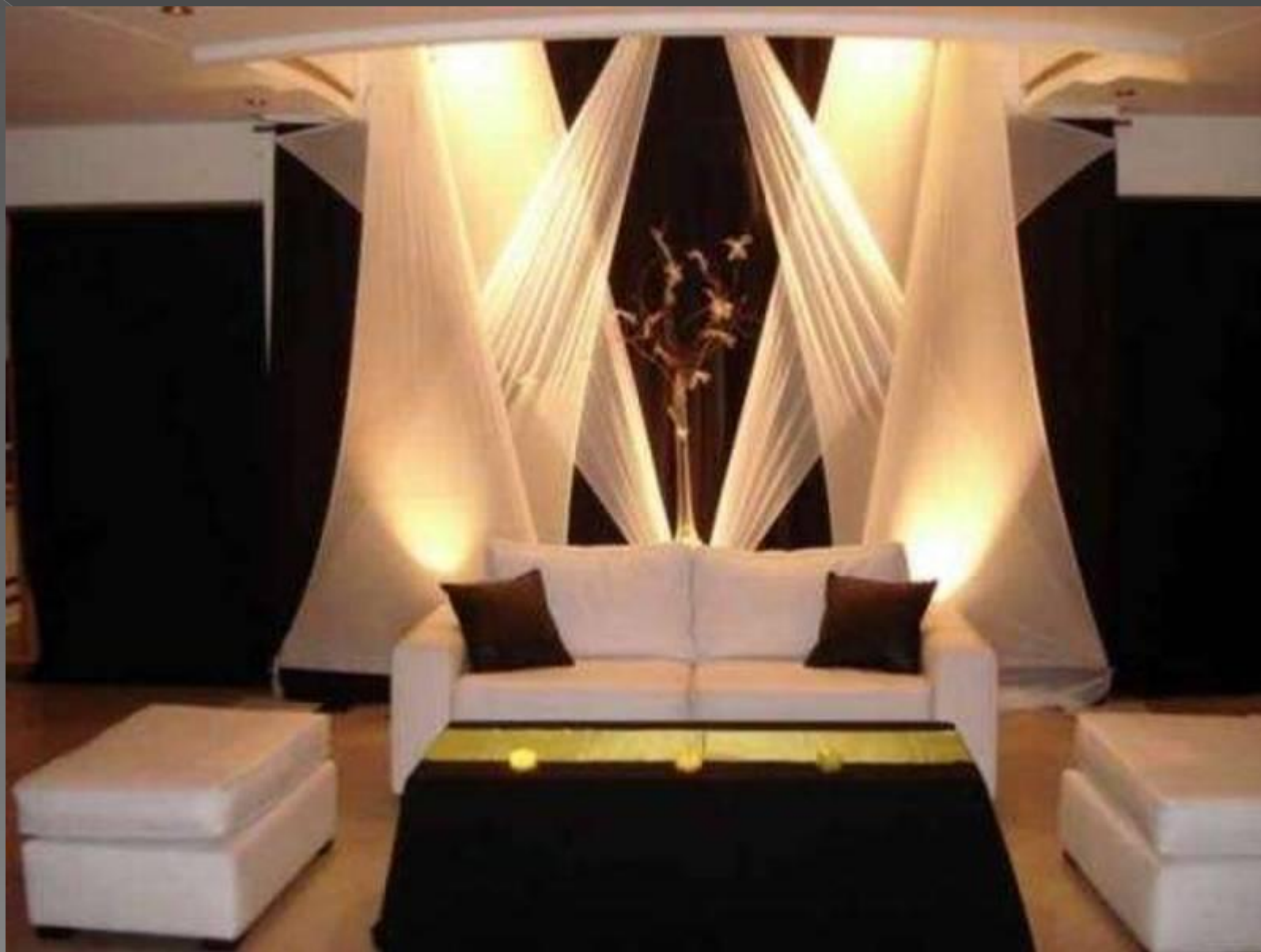
DECORACIÓN CON LYCRA TENSIONADA