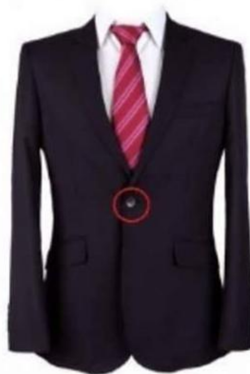
SACO DE 1 BOTON