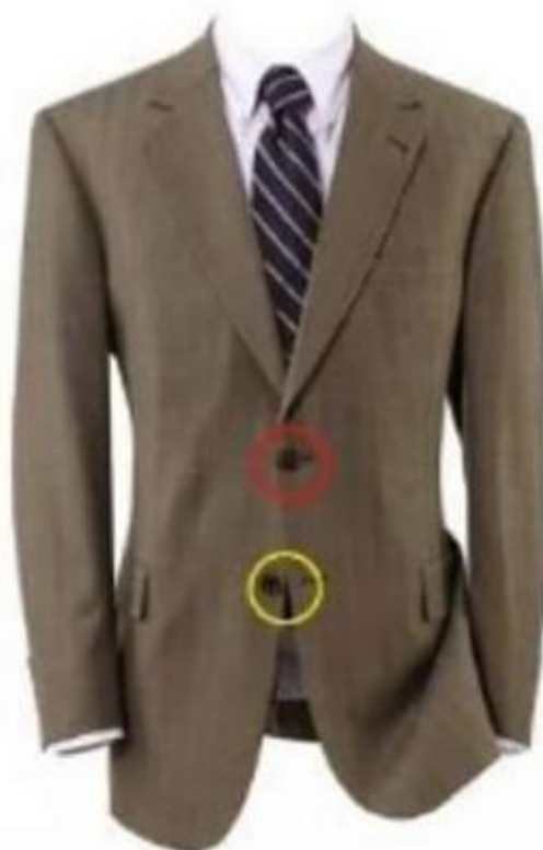
SACO DE 2 BOTONES