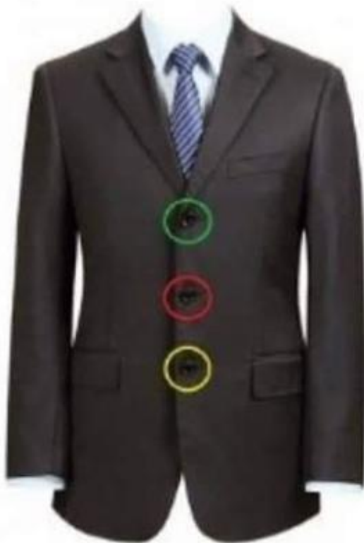
SACO DE 3 BOTONES